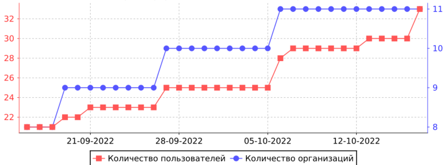
Количество зарегистрированных пользователей и организаций по дням